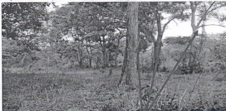
Individuos seleccionados para aprovechar

Evidencias del sitio y árboles objeto del aprovechamiento