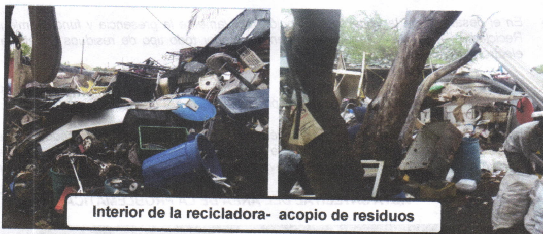
Interior de la recicladora- acopio de residuos