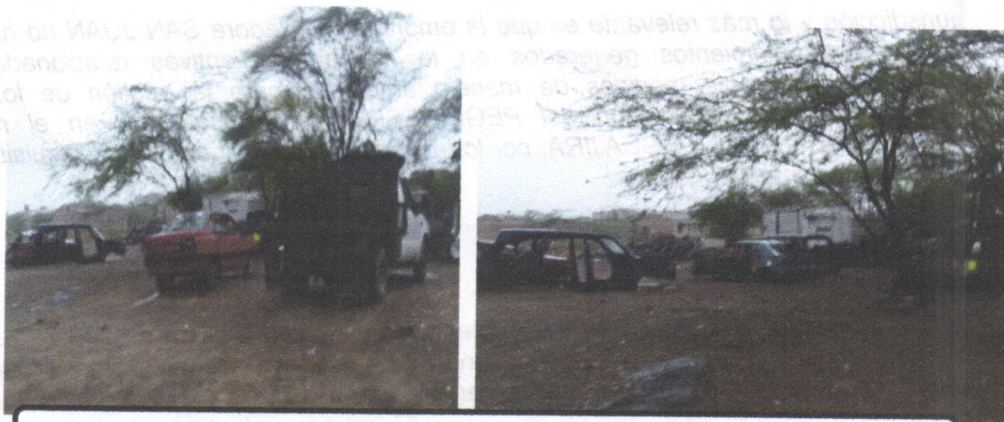
Residuos tino chatarra fuera de la recicladora