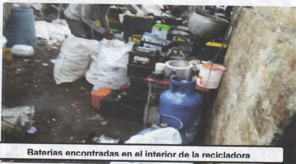
Baterías encontradas en el interior de la recicladora