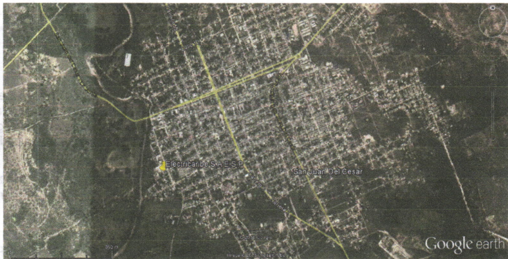
Figura 1: Ubicación satelital de árboles en subestación de ELECTRICARIBE S.A E.S.P