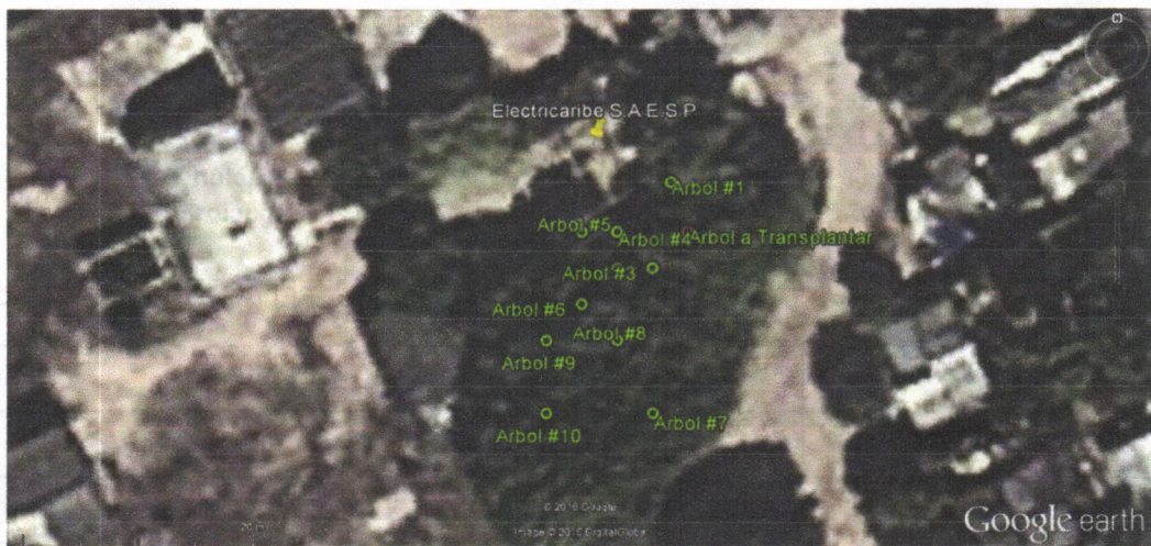
Figura 2: Ubicación de Arboles dentro de la subestación de ELECTRICARIBE S.A E.S.P