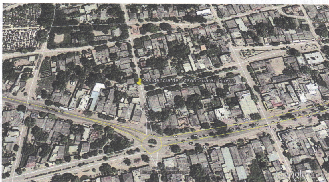
Imagen 6: Residencia de Yitson Suarez Guerra