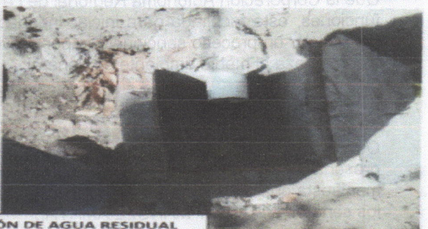
SISTEMA DE CONDUCCIÓN DE AGUA RESIDUAL