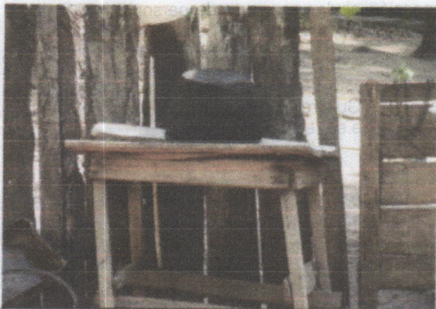
SITIO DESTINADO PARA EL PROCESO DE SACRIFICIO DE CERDOS