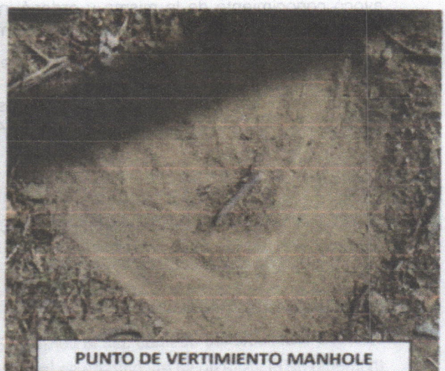
PUNTO DE VERTIMIENTO MANHOLE