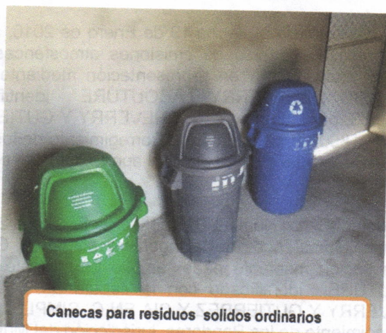
Canecas para residuos sólidos ordinarios