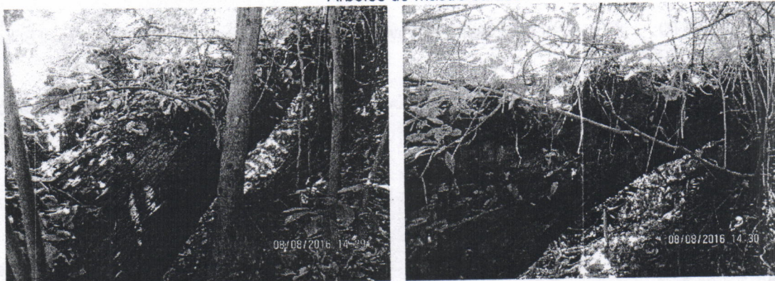
Arboles de caracolí Caídos