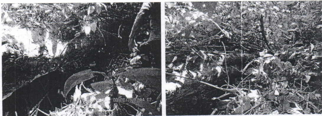
Arboles de Mastre caídos