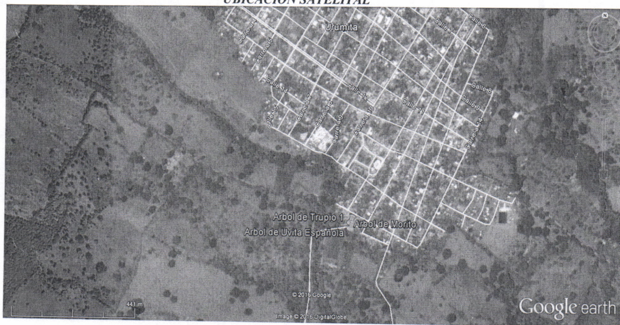
Figura 1: Ubicación Satelital de Arboles solicitados a Talar