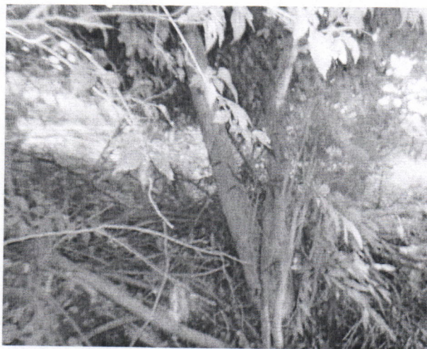
Imagen 1 Árbol de Uvita Española