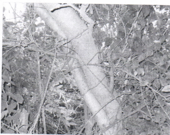
Imagen 2 Árbol de Morito