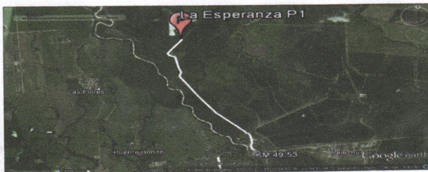
Figura No.1 Localización de la perforación en el Predio