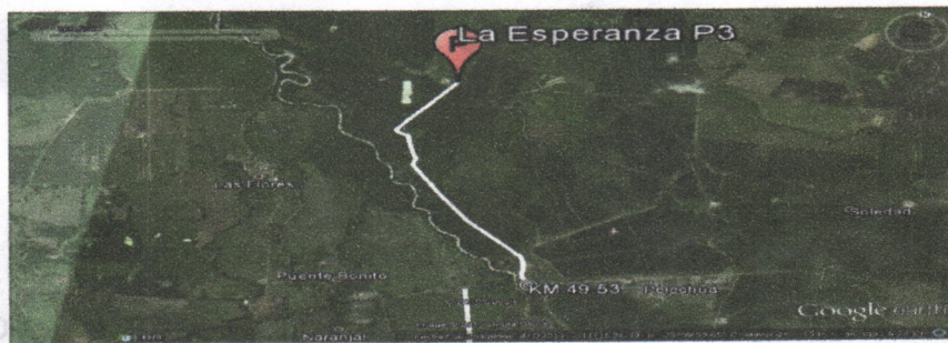
Figura No.1 Localización de la perforación en el Predio