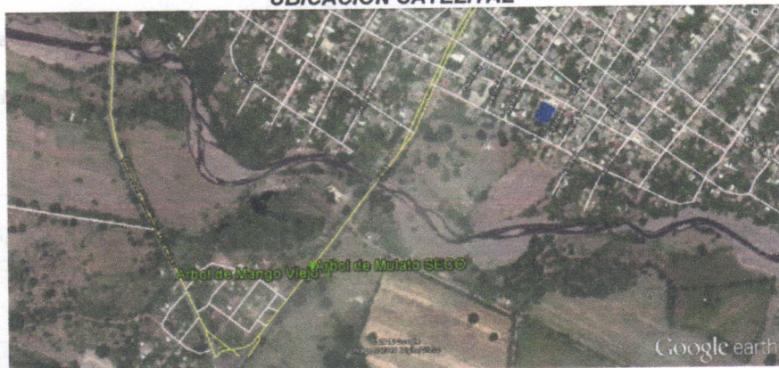
Figura 1: Ubicación satelital de árboles en predio del Señor Núñez