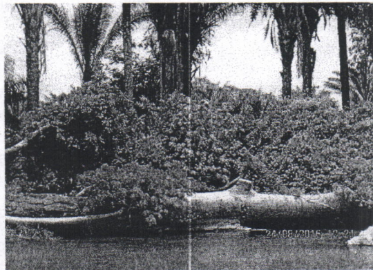
Árbol de Higuerón ( Ficus glabrata ), Ubicado dentro del cauce del río tapia