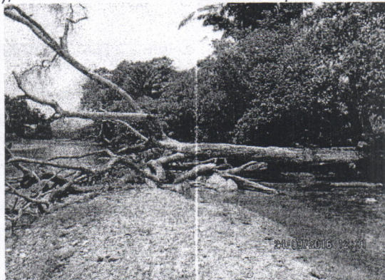
Árbol de Perehuétano ( Parinari pachyphylla Rusby), ubicado dentro del cauce río tapia