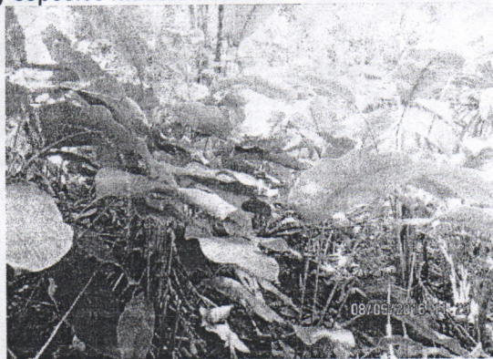
Bijao ( Calathea lutea )