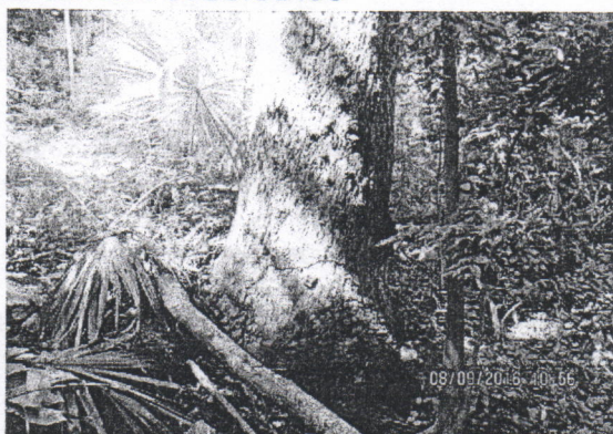
Árbol de Caracolí seco en pie y descortezado

Durante la visita se pudo evidenciar que los árboles descritos anteriormente no presentan ningún inconveniente que impida su aprovechamiento.