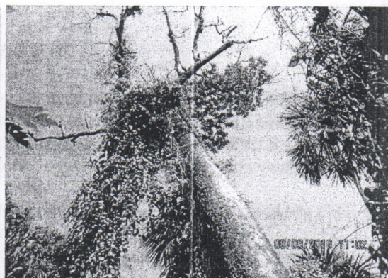
se observa la pérdida del follaje