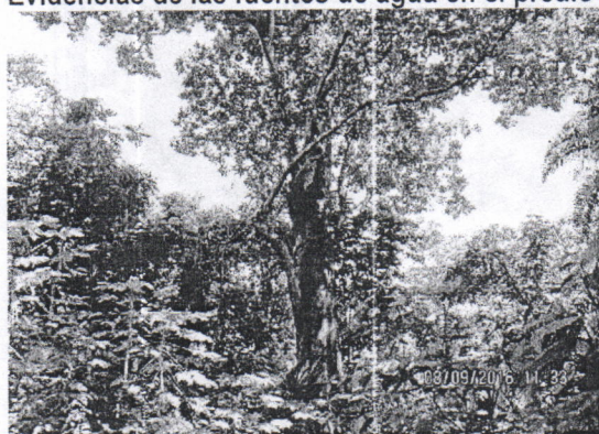
Caracolí ( Anacardium excelsum )