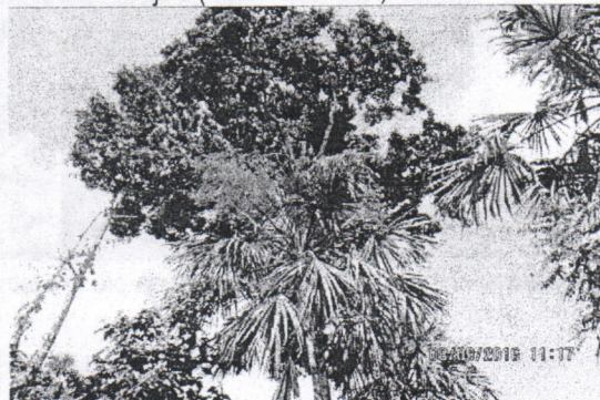
Mastre ( Pterygota colombiana )