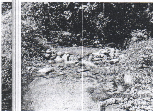
Fuente de agua que bordea el predio