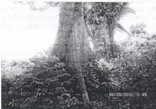
Camajón ( Sterculia apetala )