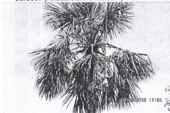
Palma amarga ( Sabal mauritiiformis )