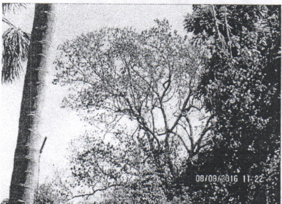
Árbol de Caracolí ( Anacardium excelsum ) en pie y totalmente quemado por un rayo