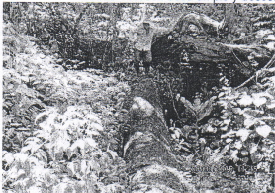
Árbol de Caracolí ( Anacardium excelsum ), seco, desbancado y caído