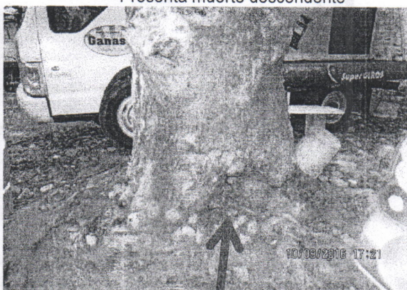
esta especie es hospedera de comején