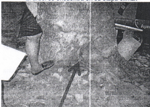
El fuste está totalmente hueco