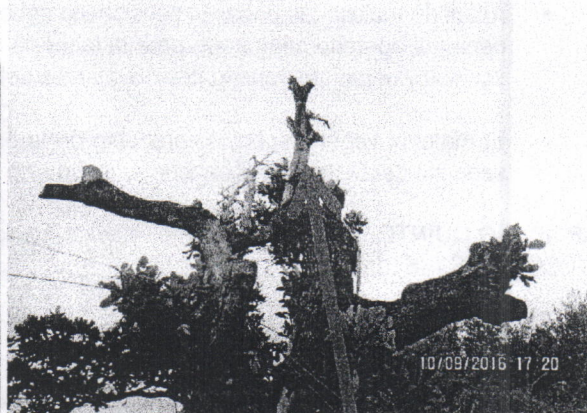
Presenta muerte descendente