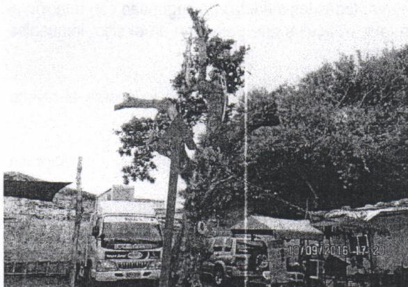
El árbol se encuentra en su etapa climax

Evidencia del árbol objeto de la solicitud de tala en la carrera 6 No. 4 – 09, Distrito de Riohacha.