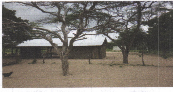
Vista de la Edificación actual a reconstruir