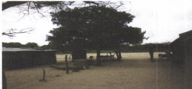
Vista de los árboles negados para La intervención, evidencia del uso que le dan actualmente en La comunidad