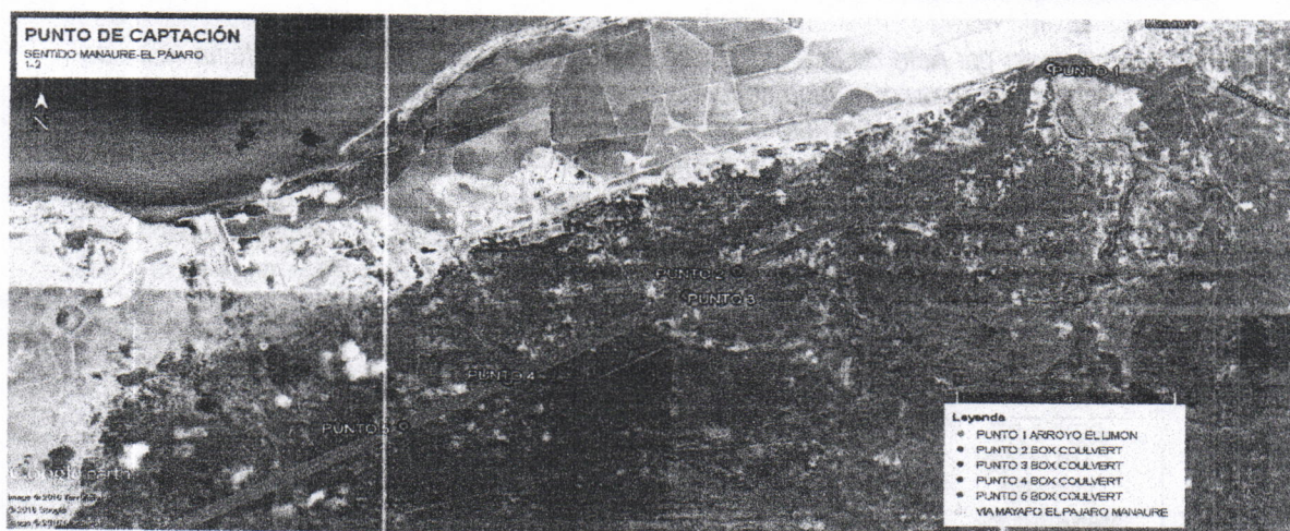
Imagen satelital 1. Ubicación geográfica general de los puntos de captación señalados en la tabla 1 del presente informe técnico.

Registro de la localización de los Once (11) puntos de donde se proyecta la captación de agua para las fuentes intermitentes localizadas a lo largo del tramo de vía El Pájaro – Manaure.