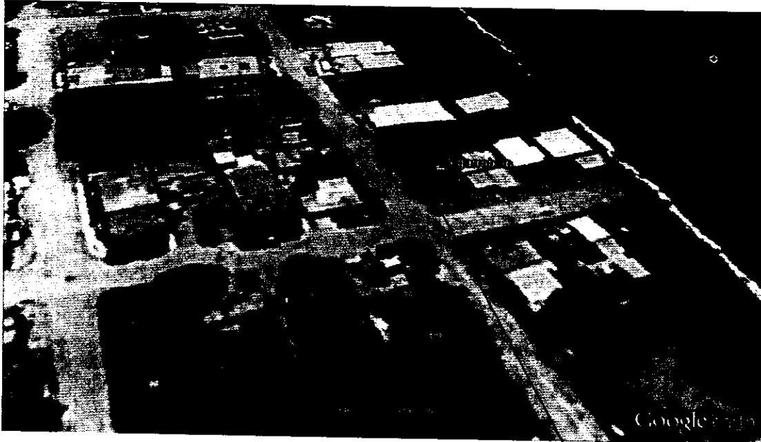
Sitio del Árbol de algarrobillo