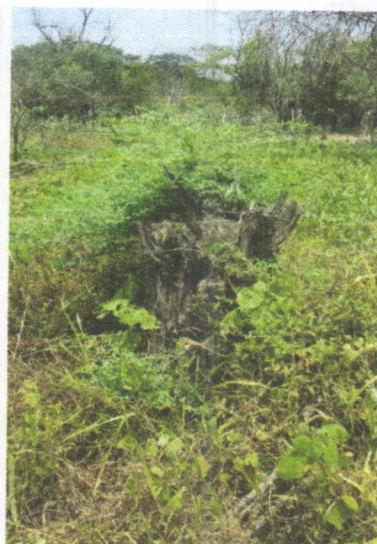
Imágenes los árboles talados y cortados en el predio de la señora RAMONA MARÍA PEREZ PADILLA