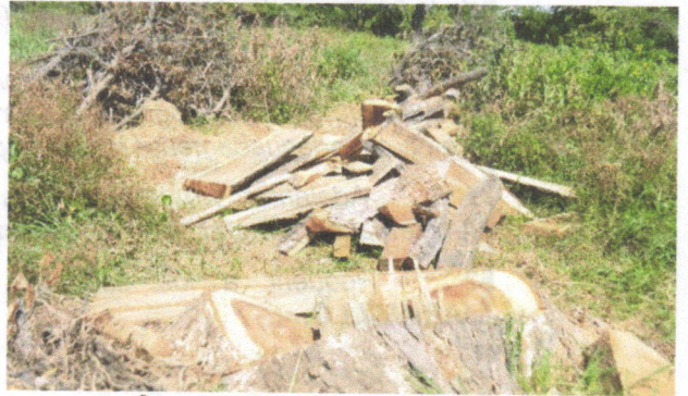
Árbol de trupillo talado