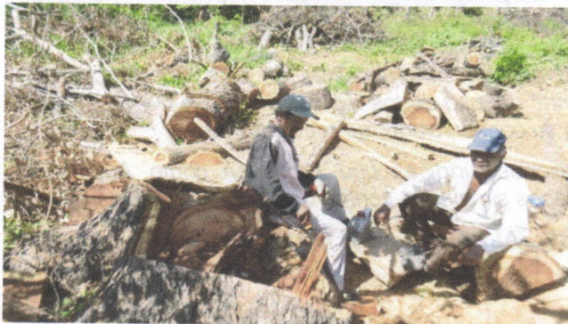
Arboles de Uvito y Guácimo talados