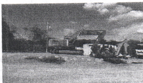
Imagen 6 Retroexcavadoras (En Funcionamiento)

En el lugar también existe una trituradora primaria y una secundaria, también una separadora de material y una zaranda que distribuye el material triturado de acuerdo a su granulometría, para su correspondiente comercialización, en la región.