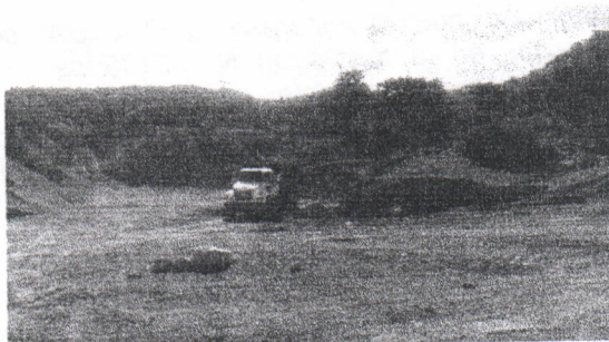
Imagen 3 Volqueta de transporte Capacidad max 18m 3