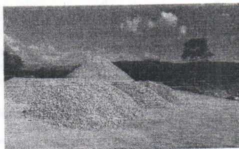
Imagen 4 Pila de Material Beneficiado (gravas)