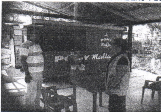
Atención de quejas de vecinos del matadero