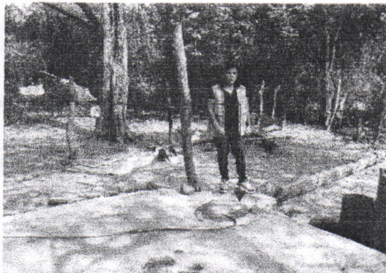
Aguas desérdiciándose en el matadero