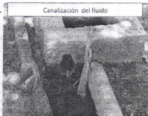
Canalización del fluido