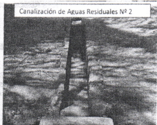
Canalización de Aguas Residuales N° 2