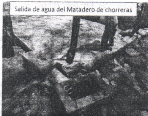
Salida de agua del Matadero de chorreras