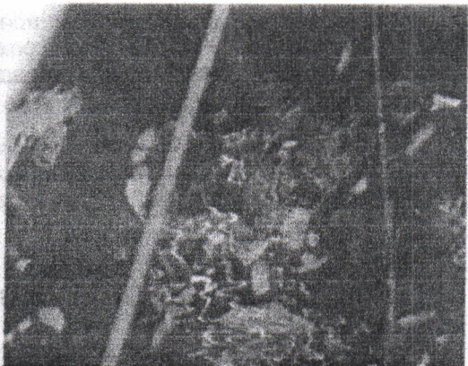
Vertimiento de agua residual con extremada carga orgánica proveniente del matadero de chorreras a acequia ubicada aproximadamente a 14 metros del matadero y presencia de huesos en el cuerpo de agua, derivados del proceso de sacrificio de animales.