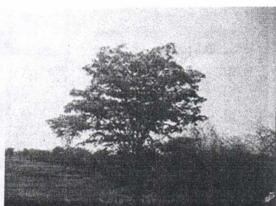
Montículos de la cobertura vegetal intervenida sin recoger y árboles de la especie Guayacán