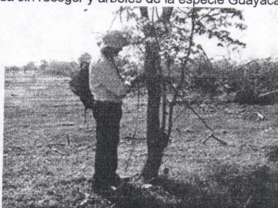
Evidencia de la visita de campo verificando los DAP de los pocos árboles aislados encontrados en pie en el área objeto de la visita.