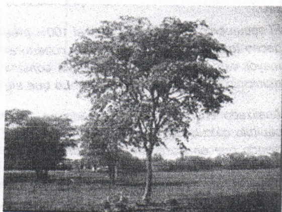
Evidencia de la cobertura del arroyo destruida y algunos árboles de guayacán para sombríos