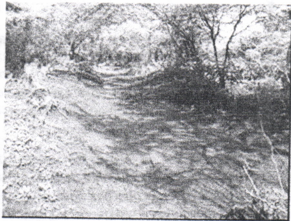
Arroyo de escorrentías superficial de aguas lluvias entrando al lote intervenido