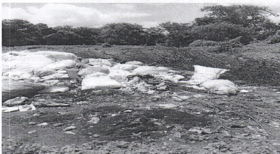
Fotografía 3. Evidencia de quemas a cielo abierto en los alrededores del sitio de la visita.