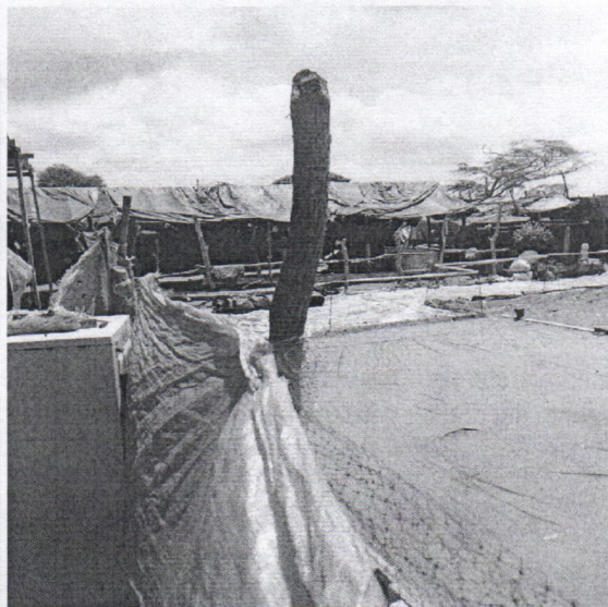
Fotografía 5. Sitio donde se realizan las actividades.

El material que se desecha de estas acciones, es quemado cada cierto tiempo, dando veracidad a la información del quejoso.