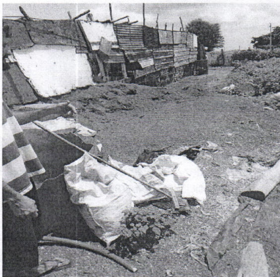
Fotografía 4. Material triturado expuesto al sol

Las actividades identificadas en el predio son de reciclar material plástico transportado en carros de tracción animal desde Maicao, luego pasan a un proceso de lavado artesanal-manual, de allí se secan al sol para luego ser triturados, expuestos a altas temperaturas y de allí evolucionan a material plástico moldeable, actualmente se elaboran mangueras sencillas para riego. El material más utilizado es el PVC. (Fotografías 4-5).