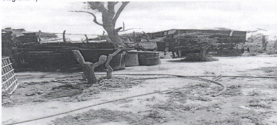
Fotografía 1. Sitio desde el cual se realizan las actividades de reciclaje. Zona Rural de Maicao

El sitio se localiza en las coordenadas N: 11°19'07.9" - O: 72°18'16.9", en zona rural del municipio de Maicao. (Fotografía 1).