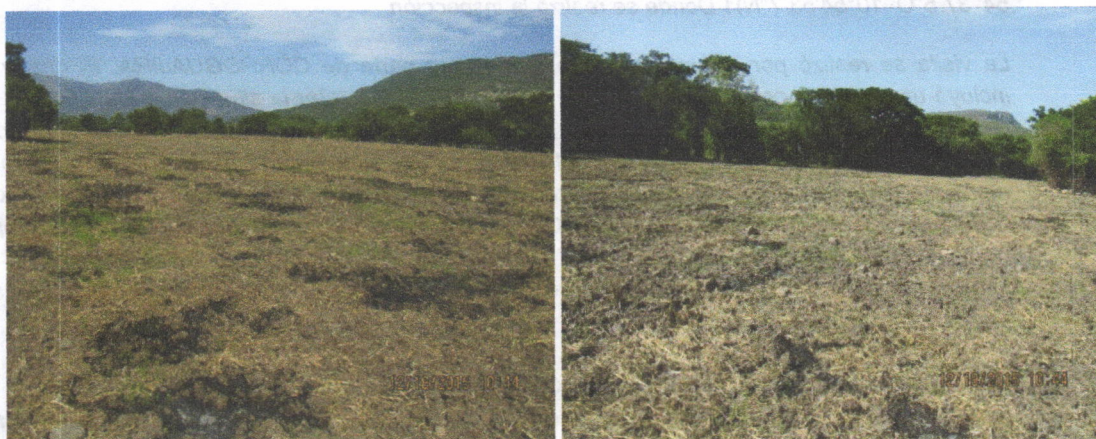
Imágenes superiores: Lote preparado de Rubén Gómez