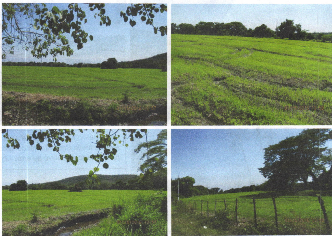
Imágenes tomadas en el lote de arroz de Rubén Gómez después 27 días de germinado