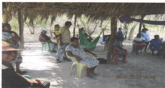
Indígenas reunidos en enramada comunitaria con funcionario de Corpoguajira

En la inspección realizada se tomó información del sitio de acuerdo a las observaciones hechas. Luego de analizar los resultados de la visita y lo manifestado en la denuncia, se concluye lo siguiente: