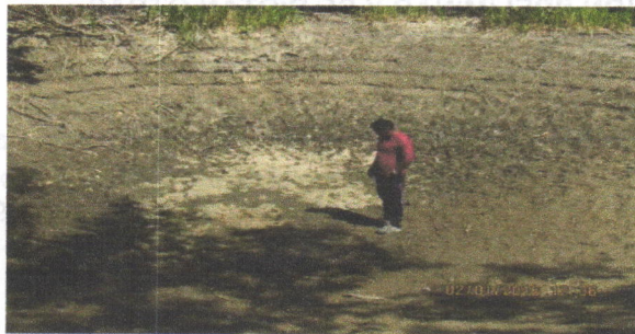
Imagen del afloramiento del manantial Pozo el Tigre protección

mayoría de los indígenas ya que ella había actuado sin consentimiento de la autoridad tradicional y CORPOGUAJIRA.