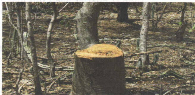
Evidencias de árboles cortados el área de