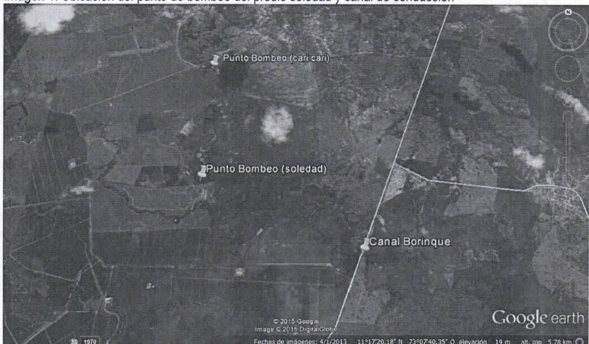
Imagen 1. Ubicación del punto de bombeo del predio soledad y canal de conducción

Puntos de Bombeo: Latitud: 11°17'17.83" N Longitud: 73° 8'20.78" W