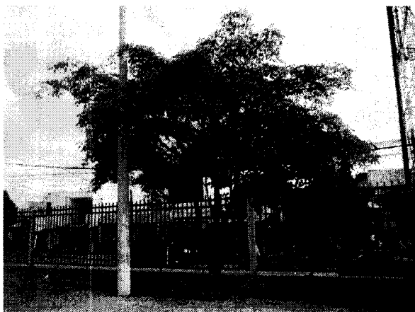
Corazónfino ( Platimiscium pinnatum )