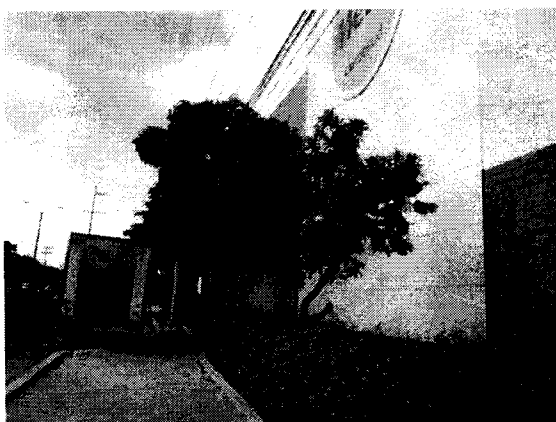
Matarratón ( Gliricidia sepium )