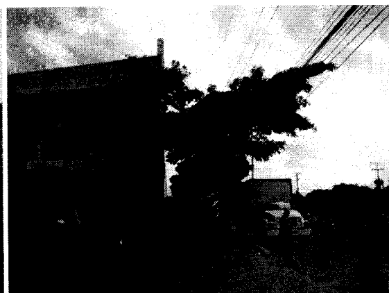
Roble ( Tabebuia rosea )