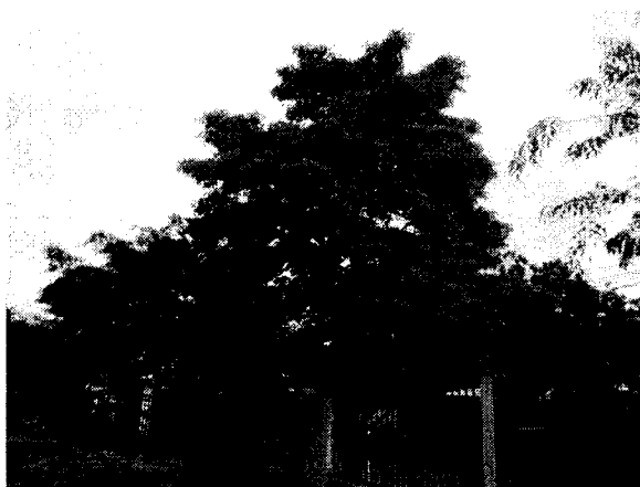
Roble ( Tabebuia rosea )