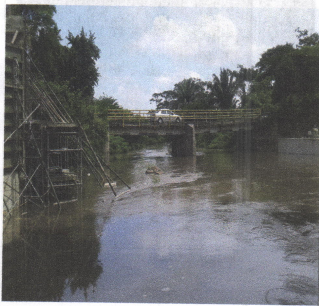
Imagen 2. Estado Actual del lecho de la quebrada.