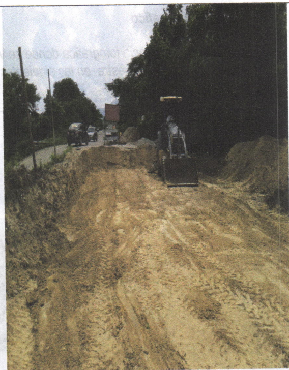
Imagen 6. Fin de la obra, Vía Cerrada.