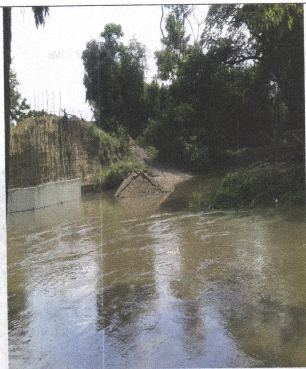
Imagen 5. Cauce Intervenido.