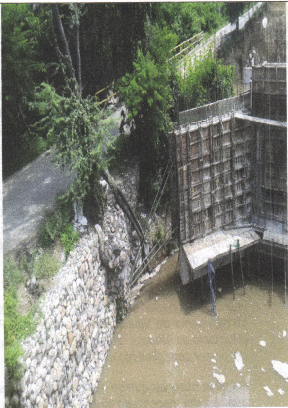
Imagen 4. Cauce Intervenido