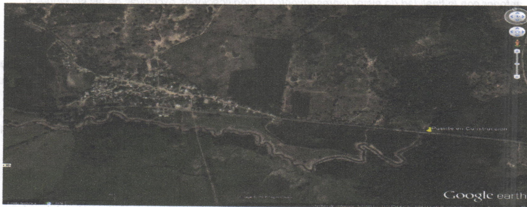
Imagen satelital 1. Ubicación geográfica del punto de la Obra (Puente en Construcción), Corregimiento de Villa Martin / fuente Google Earth.- coordenadas geográficas Datum (186WGS1984) 11°12'49.33N 72°46'51 O a una altitud de 52 msnm

La construcción de la obra se encuentra ubicada en la vía Nacional que del corregimiento de Villa Martin (Municipio de Riohacha) conduce al corregimiento de Cuestecitas (Municipio de Albania), sobre el sobrepaso del cuerpo de agua denominado Quebrada Moreno.