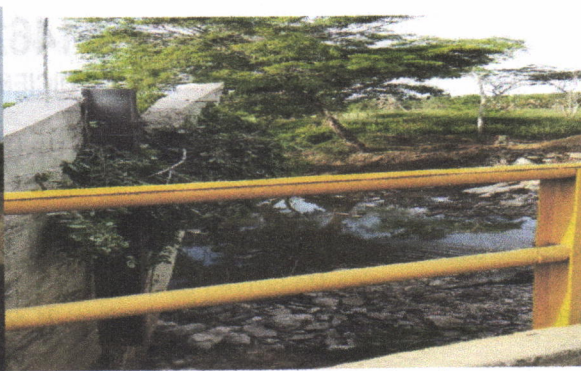
Foto 2. Puente derrumbado, material sobre el cauce.