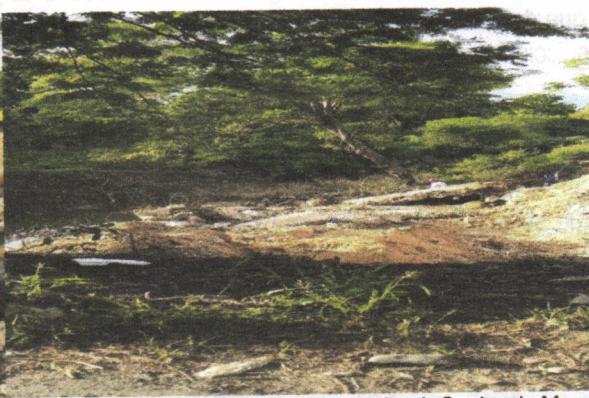
Foto 4. Material del antiguo puente sobre la Quebrada Moreno

La estructura desplomada viene ocupando el cauce de la corriente de la Quebrada Moreno, obstaculizando el recorrido normal de las aguas y generando pequeños represamientos temporales, que pueden ser mayores en la medida que la cantidad de agua que por allí pasa pueda aumentar súbitamente. Es necesario señalar que según habitantes del sector, la maquinaria del contratista ha venido ingresando de a poco en el cauce con el fin de ir despejando el área de paso de la corriente, pero debido a las lluvias presentadas en estos días se han retrasado las obras de despeje.