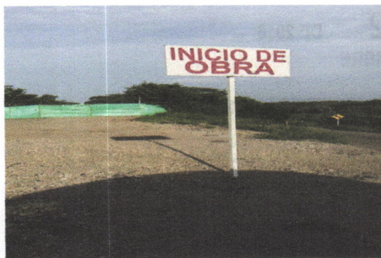
Foto 1. Sitio de la obra.