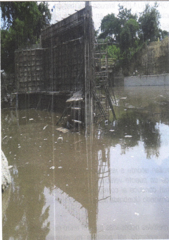
Imagen 3. Cauce Intervenido