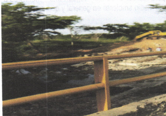
Foto 3. Maquinaria tratando de despejar el cauce.