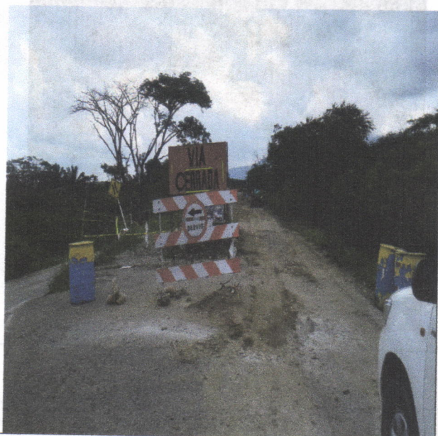
Imagen 1. Inicio de Obra, Vía Cerrada.

Se tomó una evidencia fotográfica donde se ve claramente el estado actual del sitio donde se lleva el proyecto, que se muestra en las siguientes imágenes.