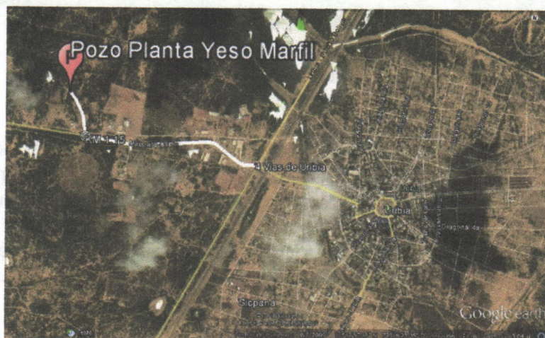
Figura No.1 Localización.

El punto de captación está ubicado, en la planta denominada Minerales Marfil S.A.S, ubicada en la zona industrial del Municipio de Uribia. Se llega al sitio por la vía que conduce del municipio de Uribia al de Manaure, cruzando a mano derecha en el kilómetro 1.15 del comienzo de 4 vías , (ver figura 1), en el punto indicado en las coordenadas mostradas en la Tabla No.1.