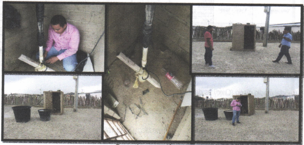
Pozo de captación.

NOMBRE DEL PUNTO: Pozo Planta Yeso Marfil COORDENADA: N 11°43'8.04" 72°17'6.20" Altura 25 m