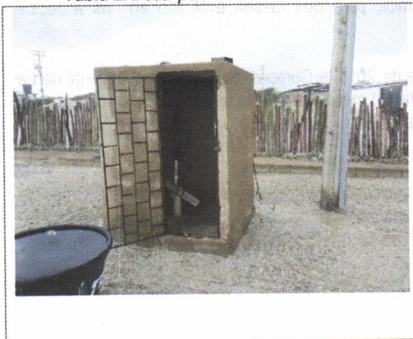
Tabla 2. Descripción del Pozo