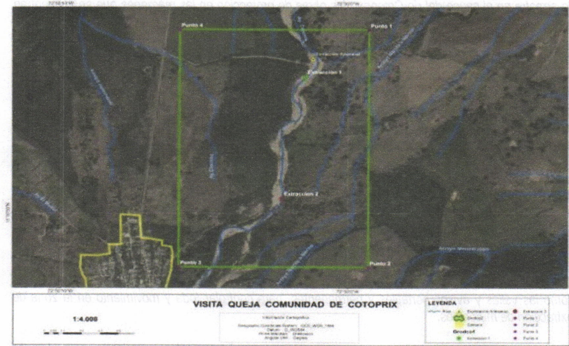
Imagen No 17. Vista en planta del polígono del área licenciada por CORPOGUAJIRA para extracción de material del río Cotoprix a la empresa GRODCO. Imagen tomada de Google earth.

Atendiendo a la queja presentada, se verifico el cumplimiento de la obligación, en la que se debía concertar la determinación de los sitios de explotación de acuerdo a condiciones específicas entre CORPOGUAJIRA y la empresa GRODCO, para lo cual se levantó un acta de aprobación y autorización No 002, en la que se establecieron zonas de depósitos para extracción de material pétreo sobre el río Cotoprix, según Resolución 02979 de 2010.