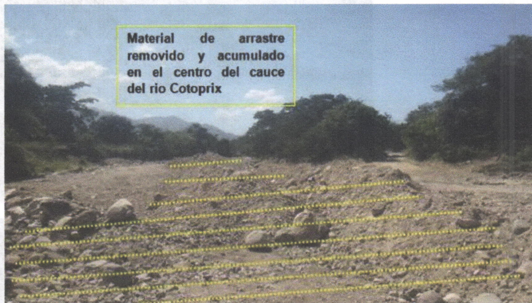
Imagen No 12. Acumulación de material removido en el cauce río Cotoprix