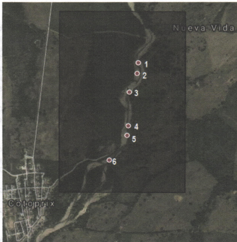
Imagen No 18. ubicación de puntos de extracción concertados entre CORPOGUAJIRA y la empres GRODCO para extracción de material de arrastre del río Cotoprix.

Durante el recorrido se evidencio que la empresa GRODCO estuvo realizando actividades de extracción de material de arrastre sobre el Río Cotoprix en las coordenadas N - 11° 10'53.00", W - 72° 50'11.5", vía al paraje Cueva Honda en intercepción con el Río Cotoprix. Dicho punto de extracción se encuentra dentro de los seis (6) puntos de extracción en los que por la condición meándrica del río, se generan depósitos significativos que pueden ser extraídos por dicha empresa y que se detallaron en el acta de aprobación y autorización ya mencionada.