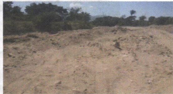
Imagen No 1 y 2. Extracción artesanal del material suelto del río y amontonándolo en pilas para el posterior cargue en volquetas que transitan dentro del mismo cauce del río

En el tramo ubicado bajo las coordenadas geográficas Datum (WGS 84) N: 11°11'17.2" W: 72°50'07.11" se encontró intervención con maquinaria dentro del cauce del río Cotoprix, allí se evidencio la remoción y el apilamiento del material de arrastre del cauce del río en mención; esta actividad se llevó acabo por parte de la empresa GRODCO y para el día 2 de enero del 2017 que se realizó esta visita, las actividades de extracción se encontraban suspendidas dejando sobre el lecho del río pilas de material de arrastre las cuales superan los 2 metros de altura y socavación de taludes. (Ver imagen No 3 y 4)