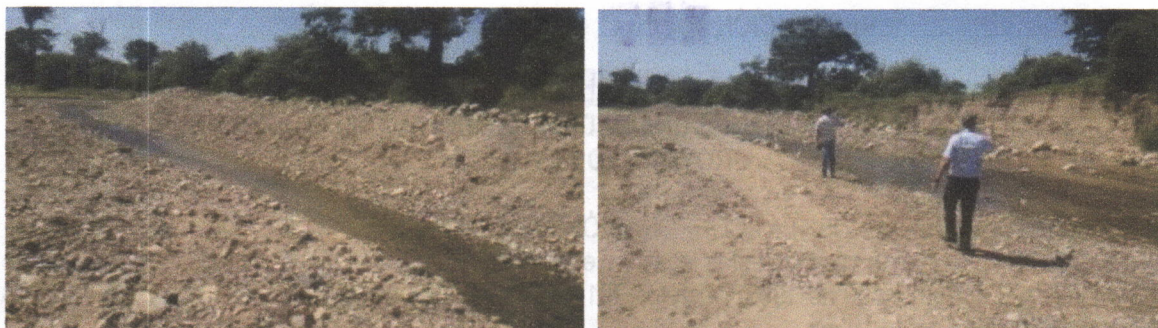
Imagen No 3 y 4. Remoción y apilamiento de material de arrastre y taludes socavados en el río Cotoprix.

Por último se llegó al punto ubicado en coordenadas geográficas Datum (WGS 84) N: 11°10'53.0" W - 72°50'11.5, donde converge el cauce del río Cotoprix con la vía que del corregimiento de Cotoprix conduce hacia la región de Cueva Honda; en este punto se evidenció una intervención por parte de la empresa C.I GRODCO sobre el lecho del río en mención, realizando extracción de material de arrastre y apilamiento del mismo sobre el cauce. Al momento de realizar la visita no se encontraron maquinarias y/o operarios de la empresa en el área. No obstante, el apilamiento del material removido en el centro del cauce genero el represamiento del río y bifurcación de la corriente hacia las márgenes lo que ocasionó una erosión pronunciada y la socavación y desestabilización del talud principalmente en la margen derecha, donde destruyendo la vía de acceso a la región de Cueva Honda, además de esto se evidenció una excavación sobre el lecho estable del cauce. (Ver imágenes 5, 6, 7 y 8)