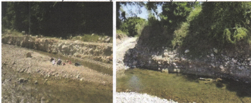
Imagen No 9 y 10. Material rígido del piso del cauce desnudado y removido.

En el recorrido realizado por el área de extracción de material de la empresa GRODCO en las coordenadas geográficas Datum (WGS 84)) N: 11°10'53.0" W - 72°50'11.5", se evidencio que el piso de cauce fue removido y desnudado en algunos tramos. (Ver imagen No 9 y 10)