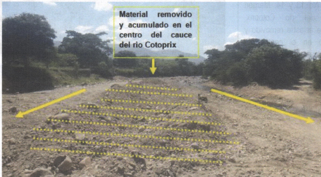
Imagen No 11. Acumulación de material removido en el cauce río Cotoprix generando represamiento y bifurcación de las aguas encausándolas por los lados laterales.

En el recorrido realizado por el río Cotoprix (arriba mencionado) se evidenció acumulación de material removido en el cauce río generando represamiento y bifurcación de las aguas encausándolas por los lados laterales generando socavación de los márgenes y taludes, destruyendo vías de acceso vehicular y desnudando material del piso del cauce del río.