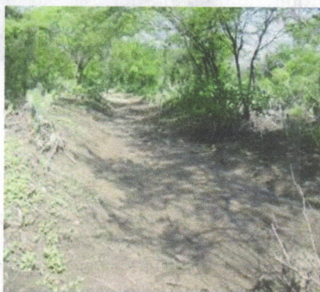
Arroyo de escorrentías superficial de aguas lluvias entrando al lote intervenido