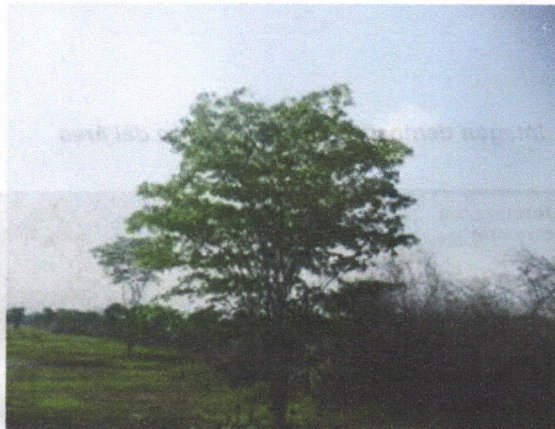
Montículos de la cobertura vegetal intervenida sin recoger y árboles de la especie Guayacán