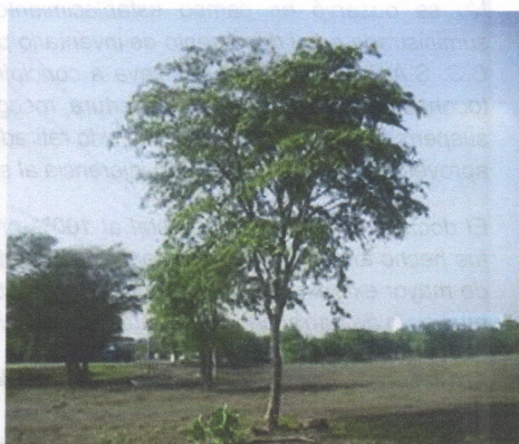
Evidencia de la cobertura del arroyo destruida y algunos árboles de guayacán para sombríos