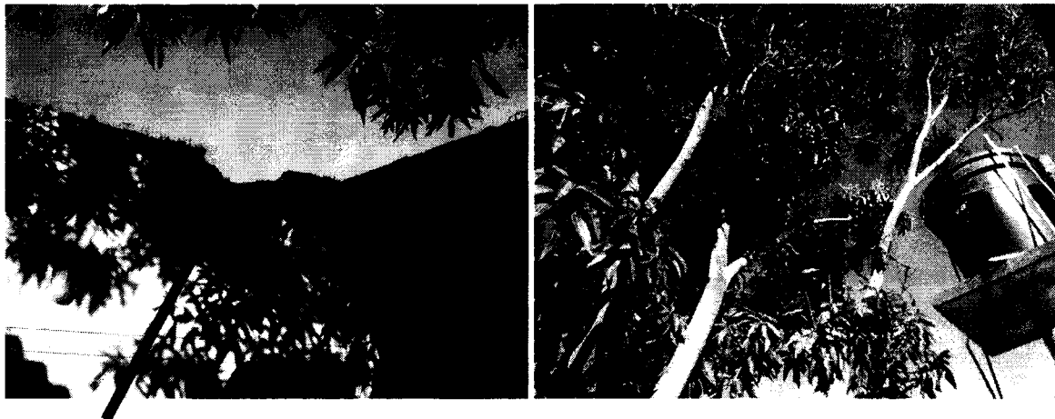
Efectos en viviendas ocasionadas por la poda anterior