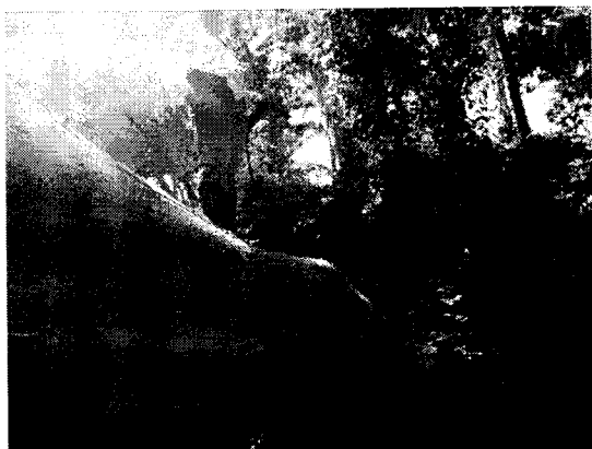
Higuerón ( Ficus glabrata )