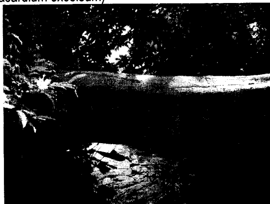
Higuerón ( Ficus glabrata )