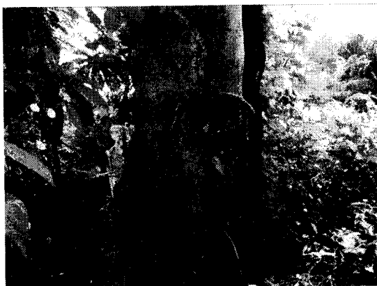
Carito ( Enterolobium cyclocarpum )