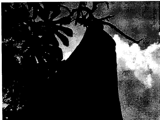
Carito ( Enterolobium cyclocarpum )