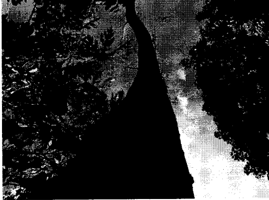
Caracolí ( Anacardium excelsum )