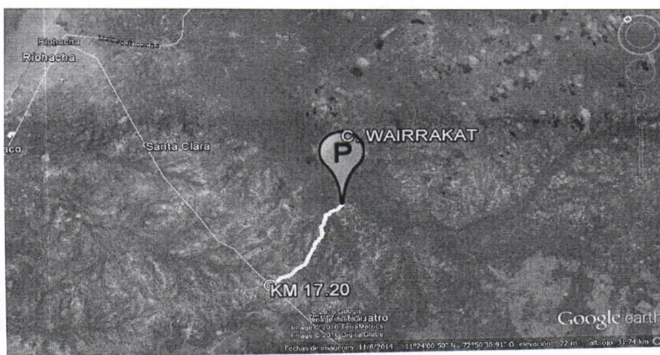
Figura No.1 Localización de la perforación en el Predio

El punto de perforación escogido se encuentra ubicado, en jurisdicción del Municipio de Riohacha Departamento de La Guajira, en la Comunidad indígena Wairrakat. Se llega al sitio por la vía que conduce de la cabecera Municipal de Riohacha al Corregimiento de cuestecitas, Cruzando a mano izquierda en el kilómetro 17.20 contados a partir de la intersección que comprende la esquina de la calle 40 con carrera 7, de la cabecera Municipal de Riohacha (ver figura 1), a partir de ahí se recorren 7.24 kilómetros, en las coordenadas mostradas en la Tabla No.1.