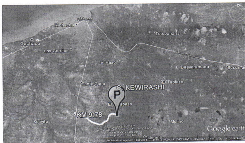
Figura No.1 Localización de la perforación en el Predio

El sitio en donde se pretenden realizar la perforación exploratoria se encuentra ubicado, en jurisdicción del Municipio de Riohacha departamento de La Guajira, en la Comunidad indígena Kewirashi. Se llega al sitio por la vía que conduce de la cabecera Municipal de Riohacha al Corregimiento de cuestecitas, Cruzando a mano izquierda en el kilómetro 9.78 contados a partir de la intersección que comprende la esquina de la calle 40 con carrera 7, de la cabecera Municipal de Riohacha (ver figura 1), a partir de ahí se recorren 6 kilómetros hacia dentro, en las coordenadas mostradas en la Tabla No.1.