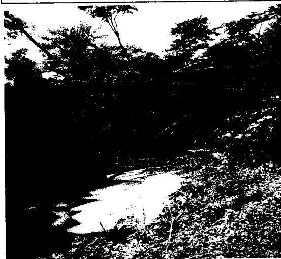
Árbol tumbado sobre el cauce del