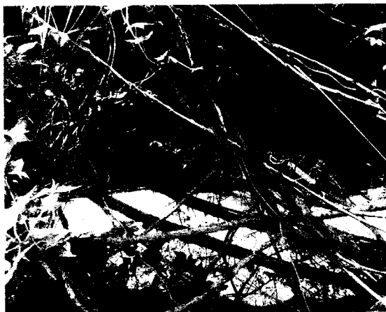
Obstrucción de circulación del agua