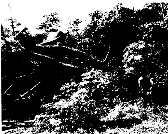
Árbol de Orejero