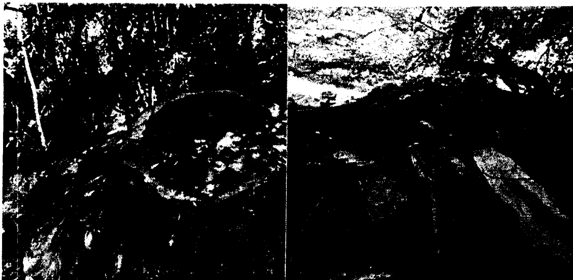
Imagen 1,2 Algarrobligo Talado.