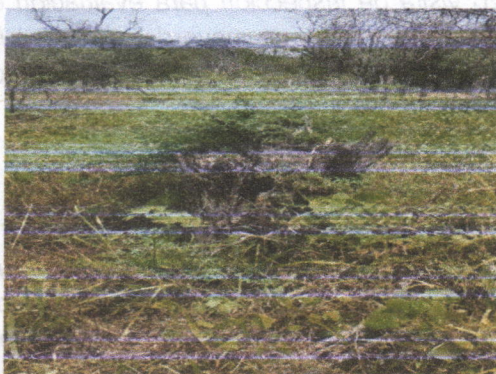
Imágenes los árboles talados y cortados en el predio de la señora RAMONA MARÍA PEREZ PADILLA