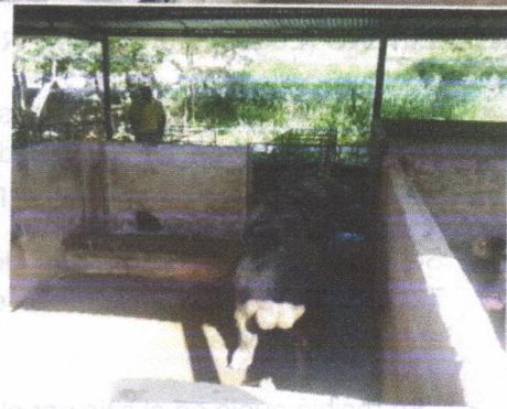
Cerdos de diversos tamaños en la porqueriza