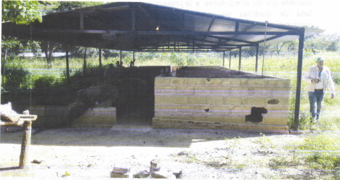
Infraestructura de Porqueriza – Vereda Los Toquitos