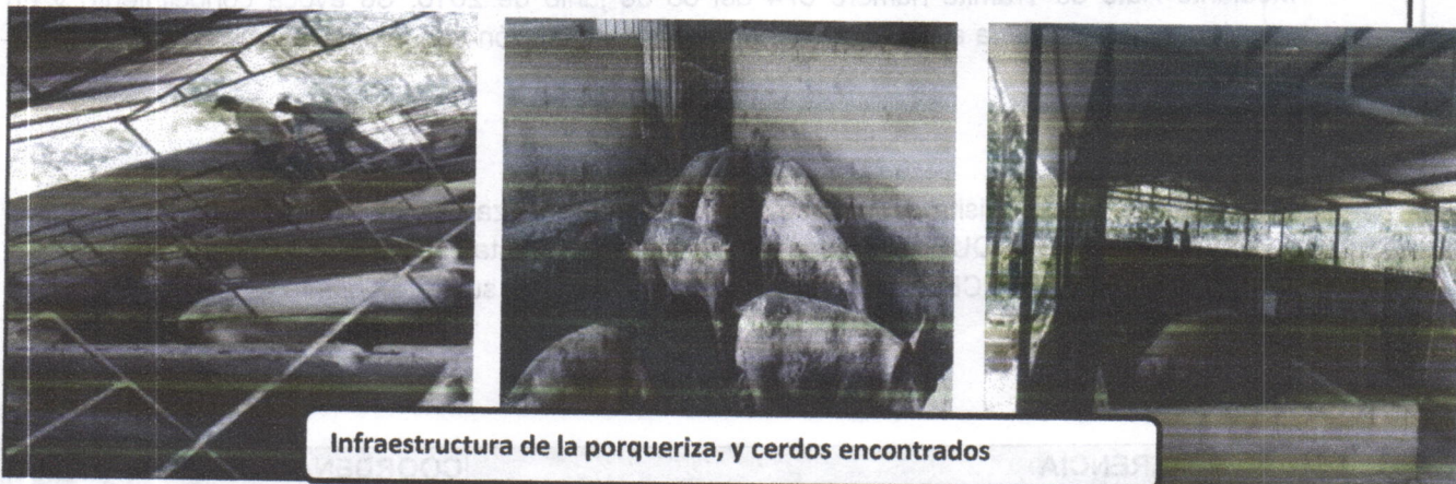
Infraestructura de la porqueriza, y cerdos encontrados