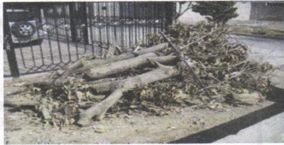
Fustes, Ramas y hojas