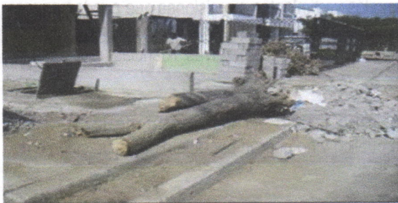
Restos del tronco y fuste