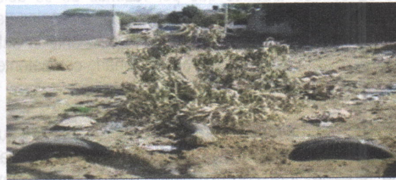
Restos de la tala en predios vecinos