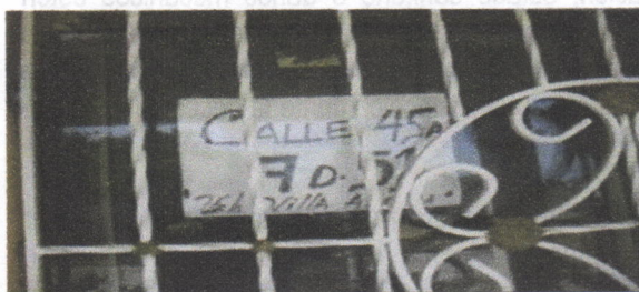
Dirección del inmueble