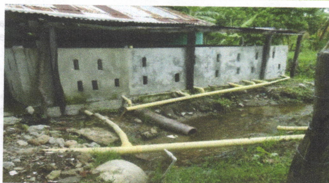
Vertimiento de aguas residuales a la acequia PENSO