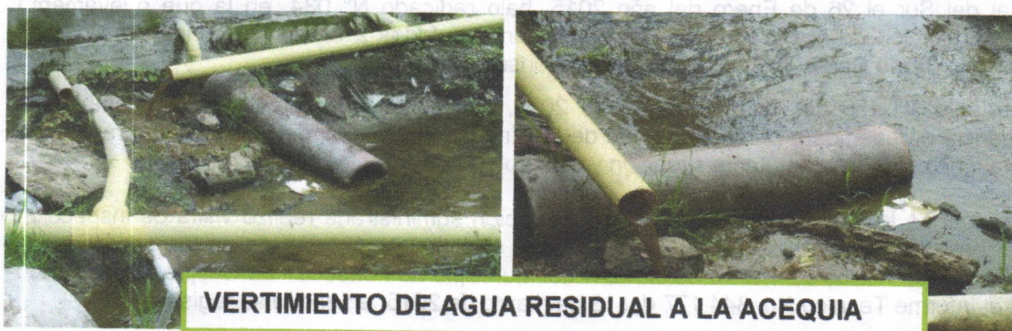
VERTIMIENTO DE AGUA RESIDUAL A LA ACEQUIA