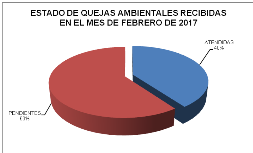
Grafica No. 3

Se observa que del total de quejas ambientales registradas (10), se respondió el 40% de acuerdo con los Cuatro (4) casos que presentan evidencia de su atención; en tal sentido se infiere que para el mes de Febrero de 2017 se encuentran Seis (6) quejas pendientes de la debida atención, lo que corresponde al 60% del total de los casos reportados por la comunidad.