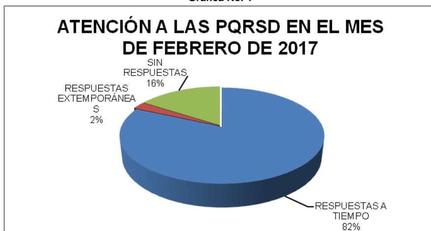
Grafica No. 1

En el informe de PQRSD correspondiente al mes de Febrero de 2017, presentado el 13 del mes de Marzo de 2017, se registró un total de 82 PQRSD, de las cuales el 82% se respondió en los términos legales establecidos, el 2% se respondió de manera extemporánea, mientras que el 16% registró sin respuesta y pendiente de la debida atención por parte del área asignada.