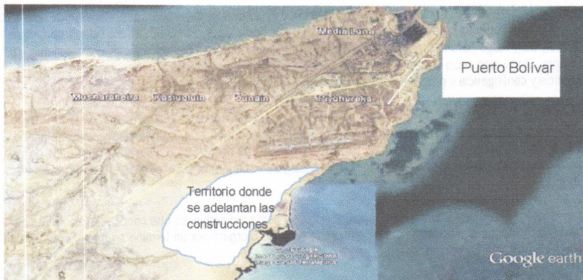
Figura. Ilustración del sitio donde se adelanta la construcción de las viviendas por parte de la empresa VANFER & CIA

En el recorrido se llegó al lugar donde se construye la vivienda a entregar a la señora VIRGINIA URIANA, la cual se ubica aproximadamente en las coordenadas (X 1228462- Y 1844048). La siguiente figura ilustra el sitio donde se adelanta el proyecto completo de viviendas: