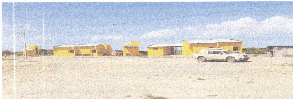
Fotografía 1. Panorámica de la fachada de las viviendas. A lado izquierdo de cada una se ubican los baños.

Las siguientes fotografías ilustran el modelo de las viviendas y el estado avance de las construcciones: