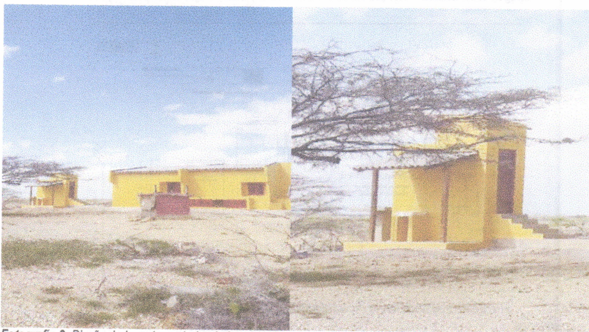
Fotografía 2. Diseño de la parte posterior de las viviendas. Fotografía 3. Vista final de lavadero y baño de la vivienda.

Igualmente se pudo observar que el terreno donde se adelantan los trabajos, es rocoso arcilloso con aporte de material calcáreos, producto de su cercanía a la franja marítima. La vegetación es monte espinoso y matorral semidesértico, propia de esta zona del país.