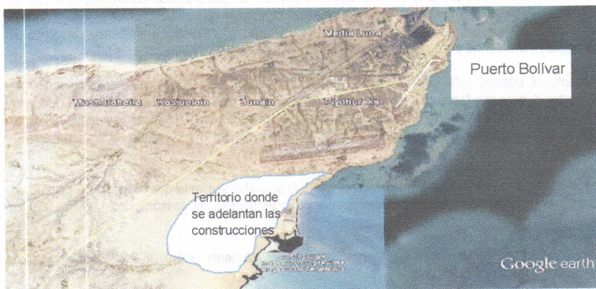
Figura. Ilustración del sitio donde se adelanta la construcción de las viviendas por parte de la empresa VANFER & CIA

En el recorrido se llegó al lugar donde se construye la vivienda a entregar a la señora PETULIA EPINAYU, la cual se ubica aproximadamente en las coordenadas (X 1229105 – Y 1844116). La siguiente figura ilustra el sitio donde se adelanta el proyecto completo de viviendas: