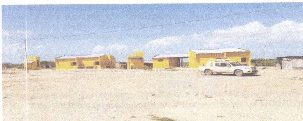
Fotografía 1. Panorámica de la fachada de las viviendas. A lado izquierdo de cada una se ubican los baños.

Las siguientes fotografías ilustran el modelo de las viviendas y el estado avance de las construcciones: