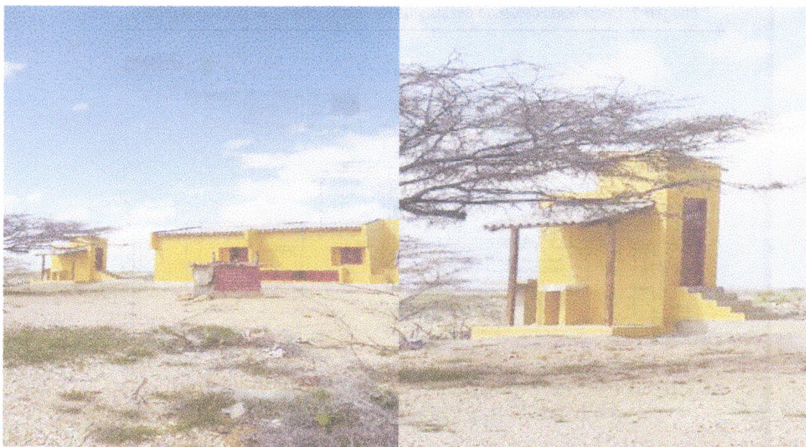
Fotografía 2. Diseño de la parte posterior de las viviendas. Fotografía 3. Vista final de lavadero y baño de la vivienda.

Igualmente se pudo observar que el terreno donde se adelantan los trabajos, es rocoso arcilloso con aporte de material calcáreos, producto de su cercanía a la franja marítima. La vegetación es monte espinoso y matorral semidesértico, propia de esta zona del país.