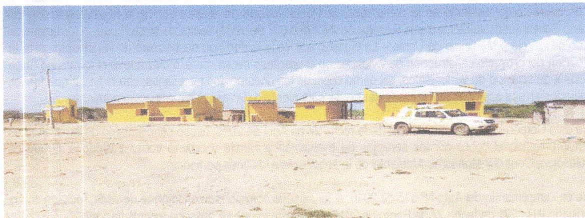
Fotografía 1. Panorámica de la fachada de las viviendas. A lado izquierdo de cada una se ubican los baños.

Las siguientes fotografías ilustran el modelo de las viviendas y el estado avance de las construcciones: