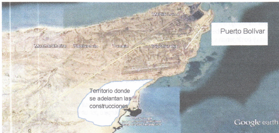
Figura. Ilustración del sitio donde se adelanta la construcción de las viviendas por parte de la empresa VANFER & CIA

En el recorrido se llegó al lugar donde se construye la vivienda a entregar a la señora ALTAMIRA EPINAYU, la cual se ubica aproximadamente en las coordenadas (X 1229154 – Y 1844123). La siguiente figura ilustra el sitio donde se adelanta el proyecto completo de viviendas: