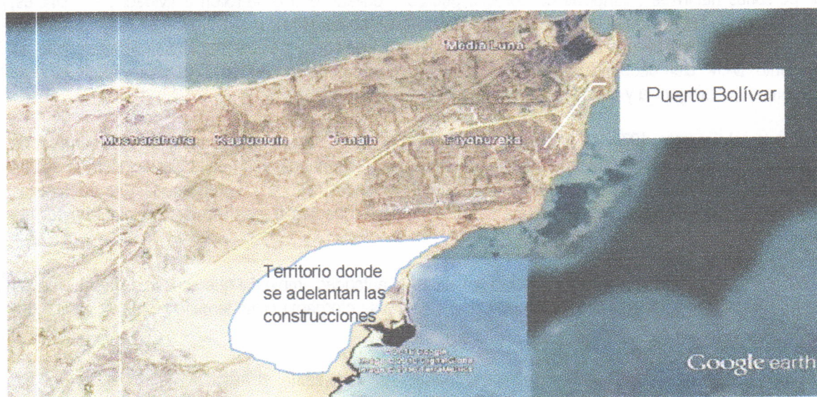
Figura. Ilustración del sitio donde se adelanta la construcción de las viviendas por parte de la empresa VANFER & CIA

En el recorrido se llegó al lugar donde se construye la vivienda a entregar al señor MICO URIANA, la cual se ubica aproximadamente en las coordenadas (X 1226497- Y 1843518). La siguiente figura ilustra el sitio donde se adelanta el proyecto completo de viviendas: