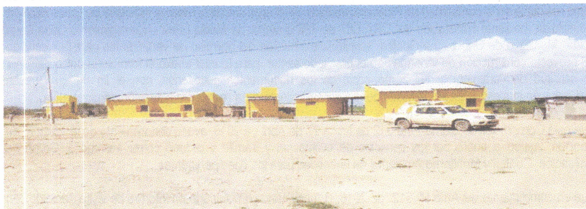
Fotografía 1. Panorámica de la fachada de las viviendas. A lado izquierdo de cada una se ubican los baños.

Las siguientes fotografías ilustran el modelo de las viviendas y el estado avance de las construcciones: