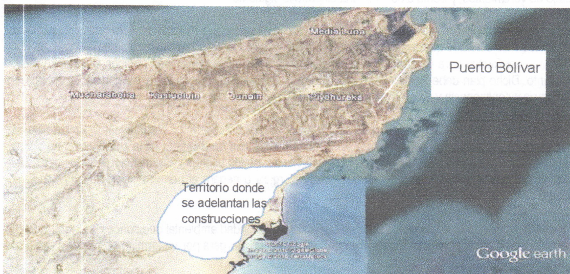
Figura. Ilustración del sitio donde se adelanta la construcción de las viviendas por parte de la empresa VANFER & CIA

En el recorrido se llegó al lugar donde se construye la vivienda a entregar a la señora KELLA PUSHAINA, la cual se ubica aproximadamente en las coordenadas (X 1228742 – Y 1844056). La siguiente figura ilustra el sitio donde se adelanta el proyecto completo de viviendas: