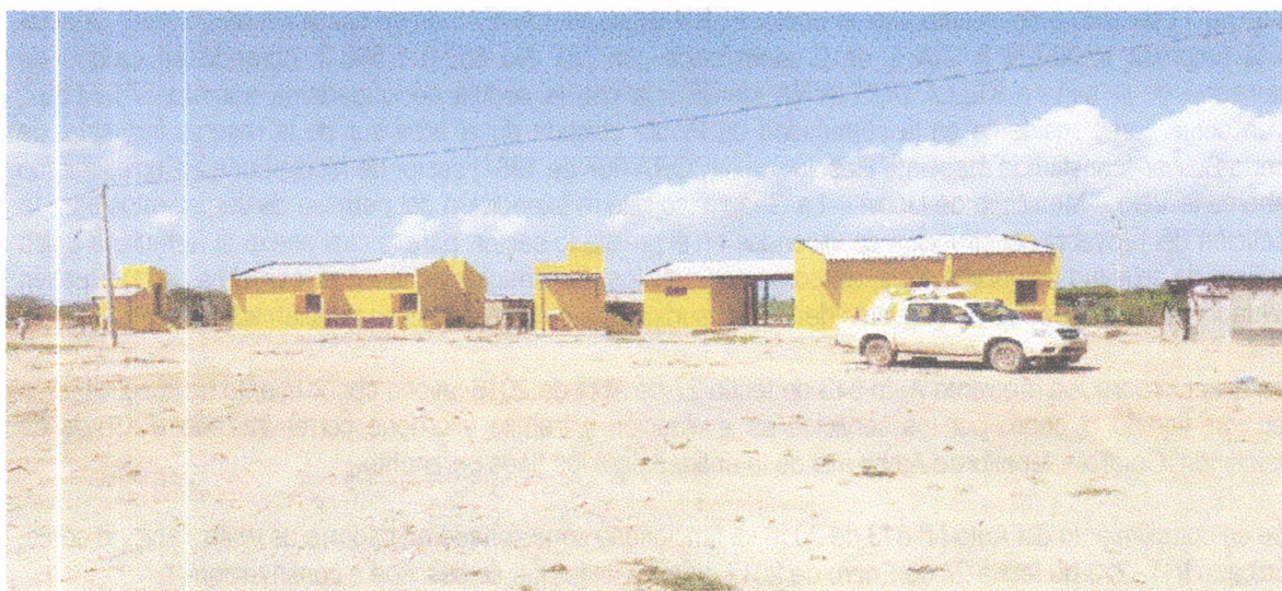
Fotografía 1. Panorámica de la fachada de las viviendas. A lado izquierdo de cada una se ubican los baños.

Las siguientes fotografías ilustran el modelo de las viviendas y el estado avance de las construcciones: