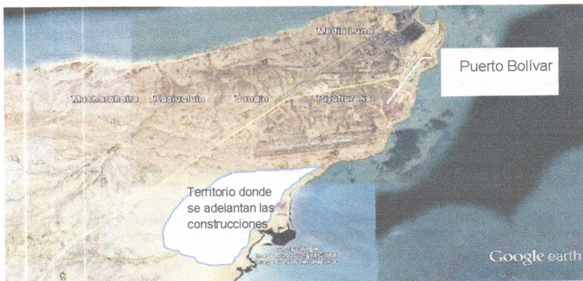
Figura. Ilustración del sitio donde se adelanta la construcción de las viviendas por parte de la empresa VANFER & CIA

En el recorrido se llegó al lugar donde se construye la vivienda a entregar a la señora BEATRIZ EPINAYU, la cual se ubica aproximadamente en las coordenadas (X 1228653 – Y 1843975). La siguiente figura ilustra el sitio donde se adelanta el proyecto completo de viviendas: