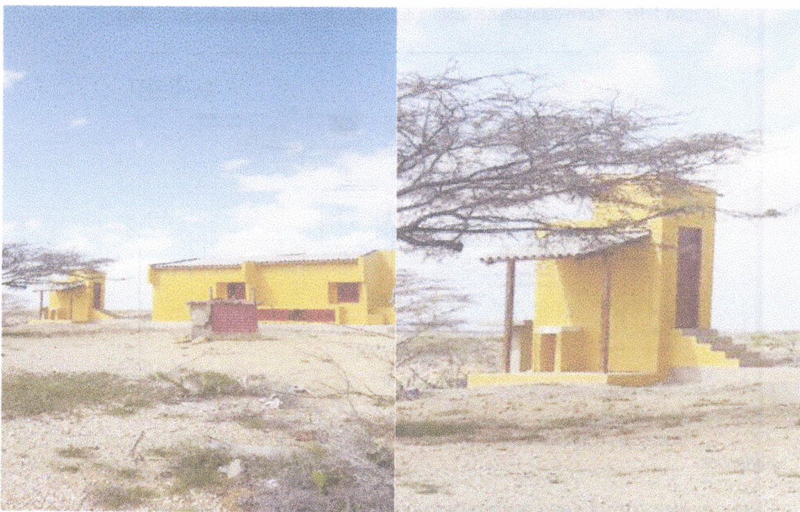
Fotografía 2. Diseño de la parte posterior de las viviendas. Fotografía 3. Vista final de lavadero y baño de la vivienda.

Igualmente se pudo observar que el terreno donde se adelantan los trabajos, es rocoso arcilloso con aporte de material calcáreos, producto de su cercanía a la franja marítima. La vegetación es monte espinoso y matorral semidesértico, propia de esta zona del país.