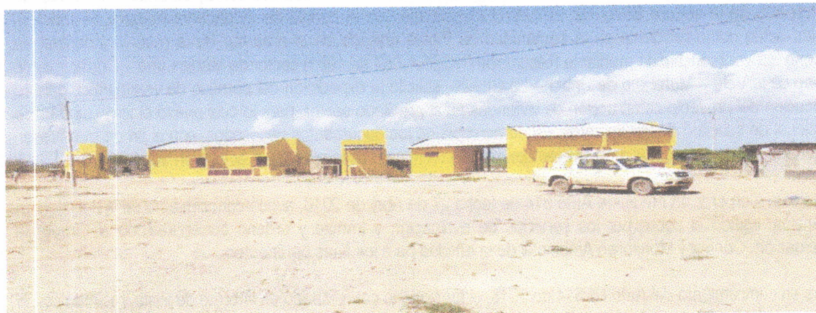
Fotografía 1. Panorámica de la fachada de las viviendas. A lado izquierdo de cada una se ubican los baños.

Las siguientes fotografías ilustran el modelo de las viviendas y el estado avance de las construcciones: