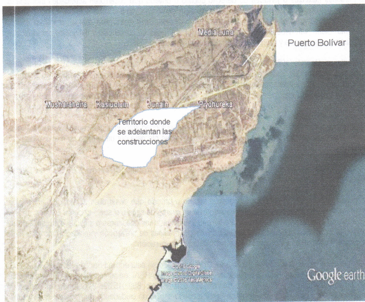
Figura. Ilustración del sitio donde se adelanta la construcción de las viviendas por parte de la empresa VANFER & CIA

En el recorrido se llegó al lugar donde se construye la vivienda a entregar a la señora RUBIA EPIEYU, la cual se ubica aproximadamente en las coordenadas (X 1227429 – Y 1843718). La siguiente figura ilustra el sitio donde se adelanta el proyecto completo de viviendas: