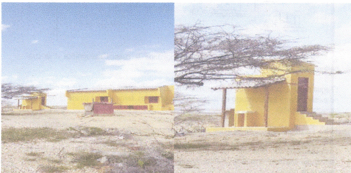
Fotografía 2. Diseño de la parte posterior de las viviendas. Fotografía 3. Vista final de lavadero y baño de la vivienda.

Igualmente se pudo observar que el terreno donde se adelantan los trabajos, es rocoso arcilloso con aporte de material calcáreos, producto de su cercanía a la franja marítima. La vegetación es monte espinoso y matorral semidesértico, propia de esta zona del país.