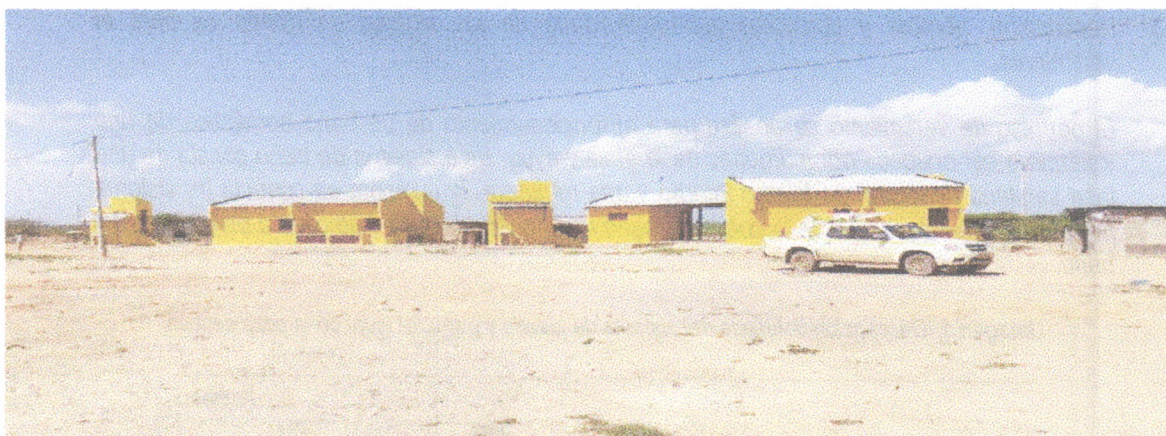
Fotografía 1. Panorámica de la fachada de las viviendas. A lado izquierdo de cada una se ubican los baños.