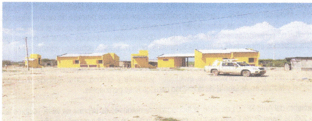
Fotografía 1. Panorámica de la fachada de las viviendas. A lado izquierdo de cada una se ubican los baños.

Las siguientes fotografías ilustran el modelo de las viviendas y el estado avance de las construcciones: