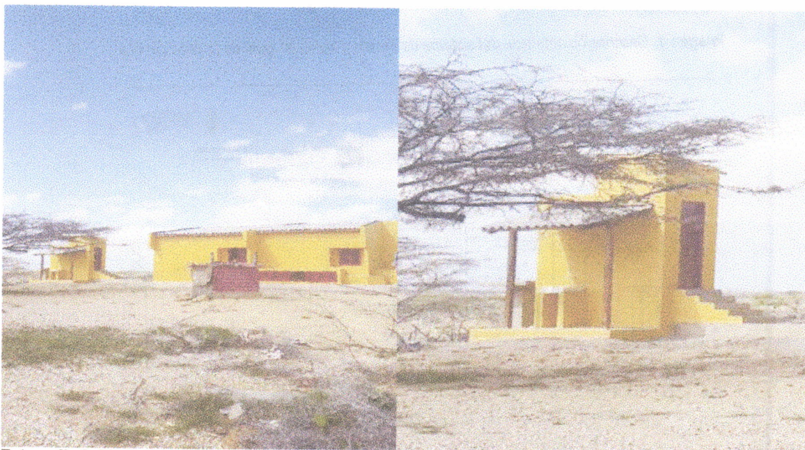
Fotografía 2. Diseño de la parte posterior de las viviendas. Fotografía 3. Vista final de lavadero y baño de la vivienda.

Igualmente se pudo observar que el terreno donde se adelantan los trabajos, es rocoso arcilloso con aporte de material calcáreos, producto de su cercanía a la franja marítima. La vegetación es monte espinoso y matorral semidesértico, propia de esta zona del país.