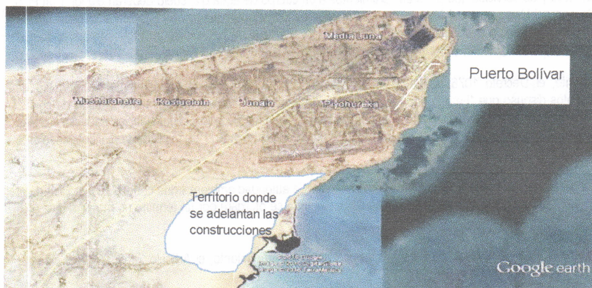
Figura. Ilustración del sitio donde se adelanta la construcción de las viviendas por parte de la empresa VANFER & CIA

En el recorrido se llegó al lugar donde se construye la vivienda a entregar a la señora FLOR ENEIDA PEREZ, la cual se ubica aproximadamente en las coordenadas (X 1226870 – Y 1843705). La siguiente figura ilustra el sitio donde se adelanta el proyecto completo de viviendas: